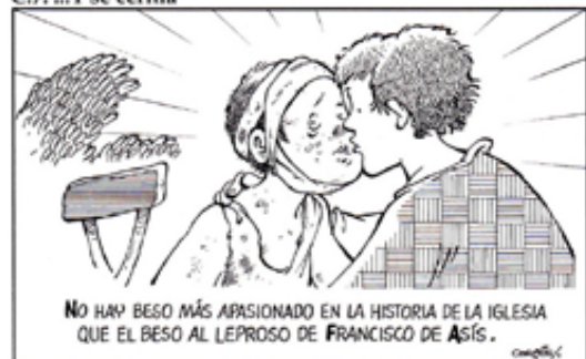
C.7: ...Y se cernía

tapadera de colorines llamativos y veamos la desnudez del Verdadero regalo que Dios nos ha hecho y ha hecho de sí mismo.