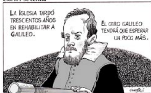
C.8: ...Y se cernía

El Hombre (y Jesús como prototipo y como arquetipo) se convirtió en el sacramento del encuentro con Dios, al tiempo que Dios escogía el ser humano como instrumento para realizar su acción en el mundo. Dios salva al hombre a través de la donación total del Hombre Jesús, que lo da todo, su vida para repartir vida. Desde entonces, Dios trabaja a través del sudor de los humanos. Dios acaricia por nuestras manos, besa por